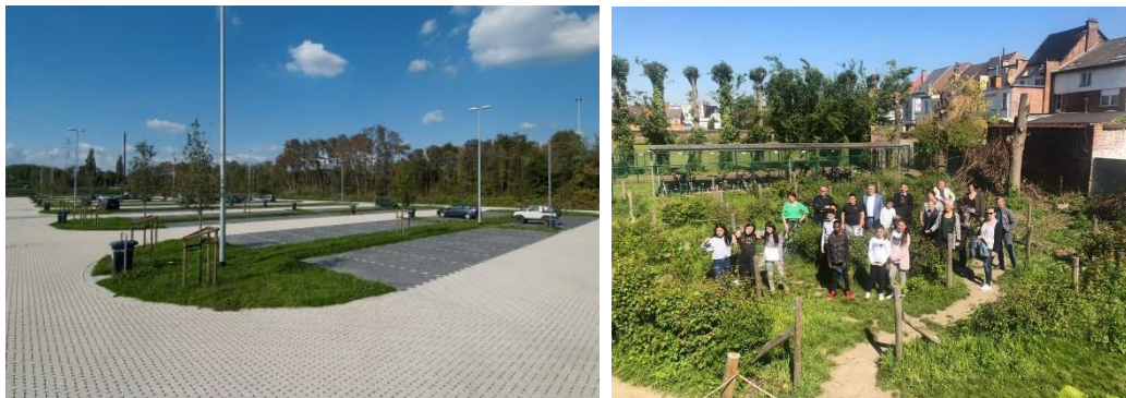
Figuur 4-3 : Voorbeelden van het toepassen van ontharden op een carpoolparking te Hasselt (links) en de ontharde speelplaats van basisschool De Knipoog te Vilvoorde (rechts; bron: Provincie Vlaams-Brabant, 2019))

Door te ontharden wordt vermeden dat hemelwater afstroomt. Het wordt bij voorkeur ingezet op grote verharde oppervlakken met een infiltratiegevoelige ondergrond. Hierbij denken we aan parkings, pleinen, speelplaatsen, ... Een aantal voorbeelden worden weergegeven in Figuur 4-3. Een overzicht van materialen en uitvoeringen die gebruikt kunnen worden bij het ontharden wordt gegeven in de Infiltratiewaaier opgemaakt door het (Netwerk Architecten Vlaanderen, 2015).