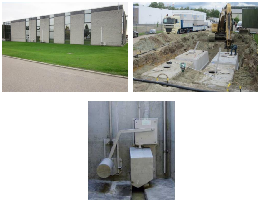
Figuur 4-6 : Voorbeelden van het bovengronds (bovenaan links; bron: Vlario, 2014) of ondergronds bufferen (bovenaan rechts; bron: Vlario, 2014) en van een Hydroslide debietbegrenzer (onderaan; bron: Steinhardt Wassertechnik GmbH, n.d.)