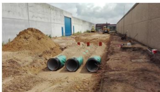
Figuur 4-5 : Voorbeelden van wadi te Zoersel (bovenaan; bron: Pidpa) en ondergrondse infiltratie met kratten (onderaan links; bron: Pidpa) en infiltratieleidingen (onderaan rechts; bron: Vlario, 2017))