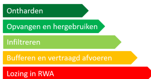
Figuur 2-1 : De brongerichte omgang met hemelwater op basis van de ladder van Lansink

Een eerste basisprincipe om deze uitdagingen aan te gaan is het scheiden van afvalwater en hemelwater. Hierbij wordt voorzien in afzonderlijke afvoer voor afvalwater (droogweerafvoer of DWA) en hemelwater (regenwaterafvoer of RWA). Ook bij het omgaan met het gescheiden hemelwater hebben we te maken met bovenstaande uitdagingen om bij te dragen aan het verminderen van de negatieve gevolgen van overstromingen, van droogte en van de daling van de grondwatertafel. Een tweede basisprincipe is het inzetten op een brongerichte aanpak. Deze omvat een getrapte strategie waarbij, in deze volgorde, ingezet wordt op het vermijden van verharding of ontharden van bestaande verharde oppervlakken, het opvangen en hergebruiken van hemelwater, het infiltreren, het bufferen en vertraagd afvoeren en in laatste instantie het lozen op een regenwaterafvoer voorziening. Dit principe wordt de ladder van Lansink voor het omgaan met hemelwater genoemd en wordt weergegeven in Figuur 2-1.