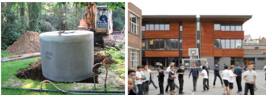
Figuur 4-4 : Het plaatsen van een hemelwaterput voor het opvangen en hergebruiken van hemelwater (links) en de IMMI school te Anderlecht waar hemelwater opgevangen wordt en gereinigd tot drinkwater (rechts)

Daarnaast kan ingezet op het collectief opvangen en hergebruiken van hemelwater, bijvoorbeeld in een verstedelijkte omgeving met beperkte ruimte voor een individuele hemelwaterput. Zo wordt in de IMMI school te Anderlecht water opgevangen van de daken en gezuiverd tot drinkwater (Gids Duurzame Gebouwen .brussels, n.d.).