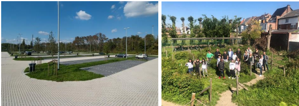
Figuur 4-3 : Voorbeelden van het toepassen van ontharden op een carpoolparking te Hasselt (links) en de ontharde speelplaats van basisschool De Knipoog te Vilvoorde (rechts))

Door te ontharden wordt vermeden dat hemelwater afstroomt. Het wordt bij voorkeur ingezet op grote verharde oppervlakken met een infiltratiegevoelige ondergrond. Hierbij denken we aan parkings, pleinen, speelplaatsen, ... Een aantal voorbeelden worden weergegeven in Figuur 4-3. Een overzicht van materialen en uitvoeringen die gebruikt kunnen worden bij het ontharden wordt gegeven in de Infiltratiewaaijer opgemaakt door het (Netwerk Architecten Vlaanderen, 2015).