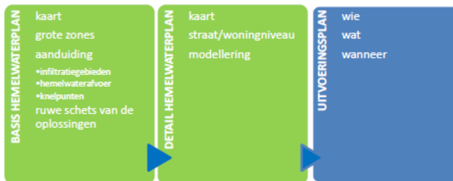
Figuur 3-1: De fases in het opmaken van een hemelwaterplan

We volgen de aanpak opgesteld door de CIW. Deze omvat de fases weergegeven in Figuur 3-1.