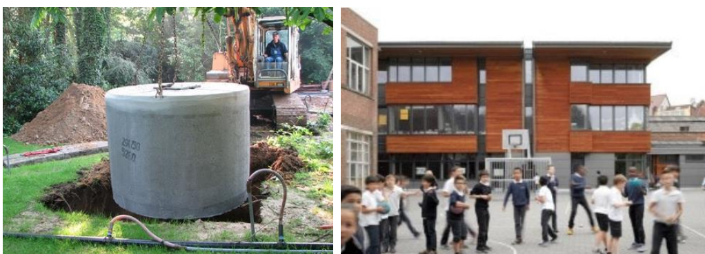
Figuur 4-4 : Het plaatsen van een hemelwaterput voor het opvangen en hergebruiken van hemelwater (links) en de IMMI school te Anderlecht waar hemelwater opgevangen wordt en gereinigd tot drinkwater (rechts)

Daarnaast kan ingezet op het collectief opvangen en hergebruiken van hemelwater, bijvoorbeeld in een verstedelijkte omgeving met beperkte ruimte voor een individuele hemelwaterput. Zo wordt in de IMMI school te Anderlecht water opgevangen van de daken en gezuiverd tot drinkwater (Gids Duurzame Gebouwen .brussels, n.d.).