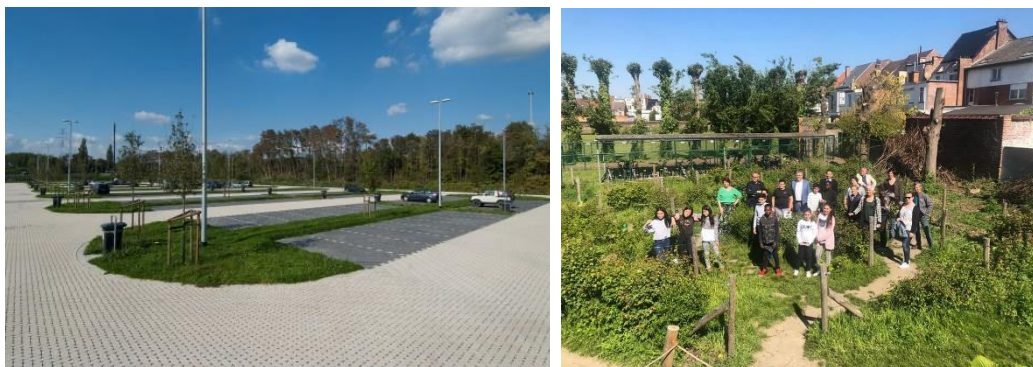
Figuur 4-3 : Voorbeelden van het toepassen van ontharden op een carpoolparking te Hasselt (links) en de ontharde speelplaats van basisschool De Knipooog te Vilvoorde (rechts; bron: Provincie Vlaams-Brabant, 2019)

Door te ontharden wordt vermeden dat hemelwater afstroomt. Het wordt bij voorkeur ingezet op grote verharde oppervlakken met een infiltratiegevoelige ondergrond. Hierbij denken we aan parkings, pleinen, speelplaatsen, ... Een aantal voorbeelden worden weergegeven in Figuur 4-3. Een overzicht van materialen en uitvoeringen die gebruikt kunnen worden bij het ontharden wordt gegeven in de Infiltratiewaaier opgemaakt door het (Netwerk Architecten Vlaanderen, 2015).