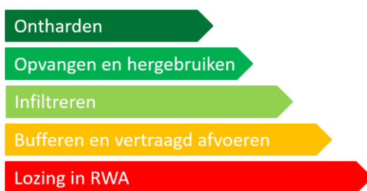
Figuur 2-1 : De brongerichte omgang met hemelwater op basis van de ladder van Lansink

Een eerste basisprincipe om deze uitdagingen aan te gaan is het scheiden van afvalwater en hemelwater. Hierbij wordt voorzien in afzonderlijke afvoer voor afvalwater (droogweerafvoer of DWA) en hemelwater (regenwaterafvoer of RWA). Ook bij het omgaan met het gescheiden hemelwater hebben we te maken met bovenstaande uitdagingen om bij te dragen aan het verminderen van de negatieve gevolgen van overstromingen, van droogte en van de daling van de grondwatertafel. Een tweede basisprincipe is het inzetten op een brongerichte aanpak. Deze omvat een getrapte strategie waarbij, in deze volgorde, ingezet wordt op het vermijden van verharding of ontharden van bestaande verharde oppervlakken, het opvangen en hergebruiken van hemelwater, het infiltreren, het bufferen en vertraagd afvoeren en in laatste instantie het lozen op een regenwaterafvoer voorziening. Dit principe wordt de ladder van Lansink voor het omgaan met hemelwater genoemd en wordt weergegeven in Figuur 2-1.