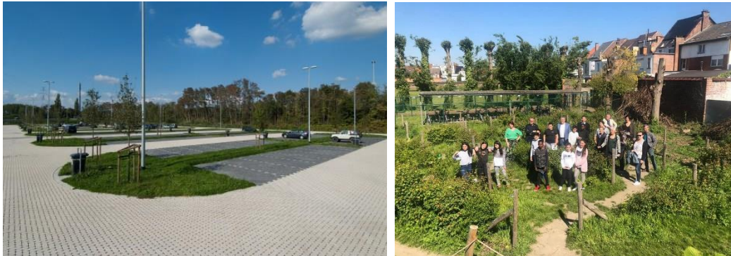
Figuur 4-3 : Voorbeelden van het toepassen van ontharden op een carpoolparking te Hasselt (links) en de ontharde speelplaats van basisschool De Knipooog te Vilvoorde (rechts)

Door te ontharden wordt vermeden dat hemelwater afstroomt. Het wordt bij voorkeur ingezet op grote verharde oppervlakken met een infiltratiegevoelige ondergrond. Hierbij denken we aan parkings, pleinen, speelplaatsen, ... Een aantal voorbeelden worden weergegeven in Figuur 4-3. Een overzicht van materialen en uitvoeringen die gebruikt kunnen worden bij het ontharden wordt gegeven in de Infiltratiewaaier opgemaakt door het (Netwerk Architecten Vlaanderen, 2015).