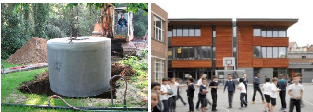
Figuur 4-4 : Het plaatsen van een hemelwaterput voor het opvangen en hergebruiken van hemelwater (links) en de IMMI school te Anderlecht waar hemelwater opgevangen wordt en gereinigd tot drinkwater (rechts)

Daarnaast kan ingezet op het collectief opvangen en hergebruiken van hemelwater, bijvoorbeeld in een verstedelijkte omgeving met beperkte ruimte voor een individuele hemelwaterput. Zo wordt in de IMMI school te Anderlecht water opgevangen van de daken en gezuiverd tot drinkwater (Gids Duurzame Gebouwen .brussels, n.d.).